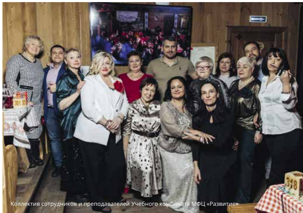
Коллектив сотрудников и преподавателей Учебного комбината МФЦ «Развитие»

Каждый бизнес сегодня должен иметь социальную составляющую. И дело не только в доброте — для клиентов важно, какой смысл стоит за услугой или продуктом, кто и зачем его создает. Не всегда социальный проект – благотворительный. Разница лишь в том, что доходность таких проектов будет несколько ниже, чем в чисто коммерческих, а вот правила игры для социального бизнеса точно такие же, как и для любого другого.