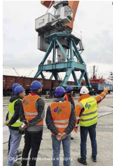
Обучение персонала в порту

на образовательную деятельность, прошли аккредитацию по обучению вопросам охраны труда в Минтруде. При этом мы понимали, что занять свое «место под солнцем» в сфере образования в кузнице кадров России, Санкт-Петербурге, не так просто, и это чисто социальный проект. На начальном этапе мы обучали свой персонал, который предоставляли для подрядных работ в порту. Связи со многими учебными заведениями, ведущими лекторами, преподавателями и бизнес-коучами позволили нам с нуля создать портфель образовательных программ и курсов по отраслевым профессиям стивидорной деятельности. Сегодня мы зарекомендовали себя как образовательный центр по подготовке персонала для портов, у нас более 50 специализированных программ, в числе наших клиентов такие крупные терминалы, как Ростерминал-голь, Еврохим, Новотранс, Туапсинский балкерный терминал, порт Темрюк и другие.