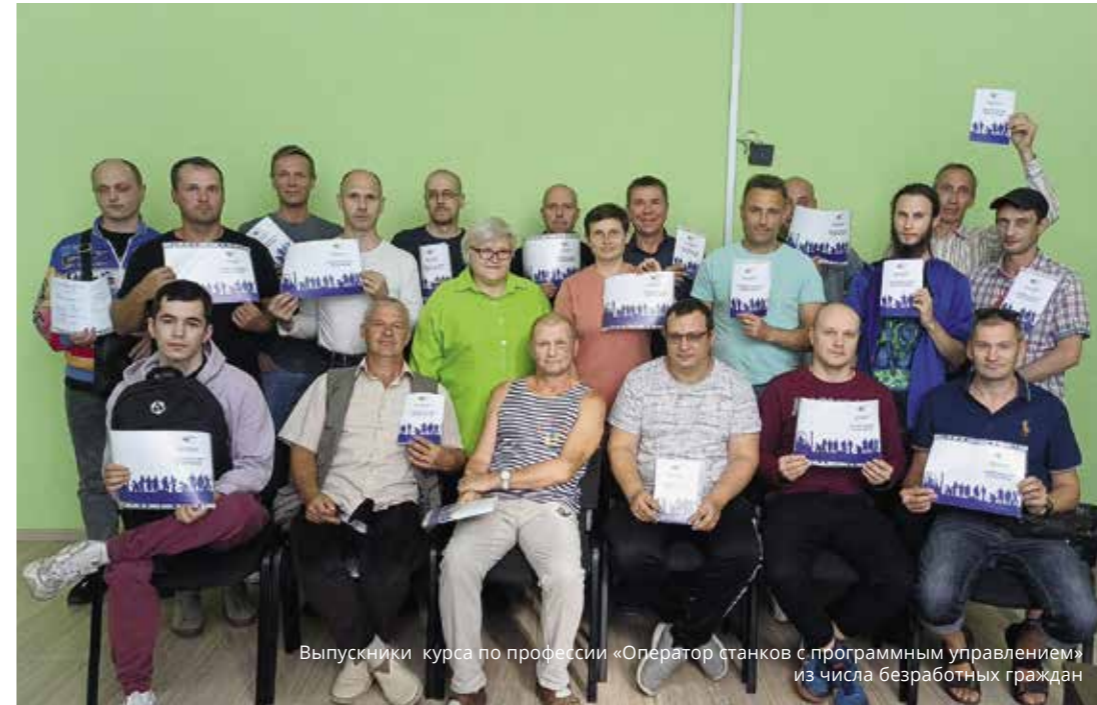
Выпускники курса по профессии «Оператор станков с программным управлением» из числа безработных граждан